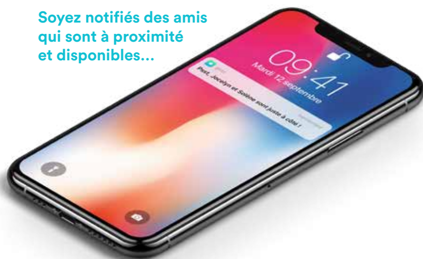
Ajoutez vos amis